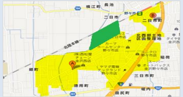
図1 つばきの郷エリア(■) 地区公園(■)(H26年完成予定)