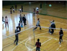
図1 トリプルソフトバレー体験会