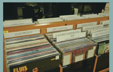
金沢工業大学 ライブラリーセンター 3F