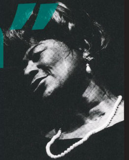
Ella Fitzgerald 1966

本展特設HP http://www.kitnet.jp/pmc/event/index.html 入場無料