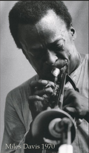
Miles Davis 1970

月 - 金 9:00 - 18:30 土 9:00 - 17:00 日・祝 10:00 - 17:00 ※10.22 MON 9:00 - 17:00