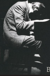
Bill Evans 1970