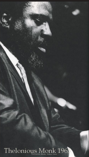
Thelonious Monk 1961