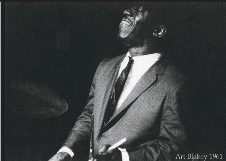
Art Blakey 1961