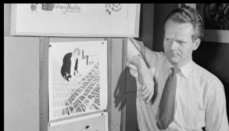
David Stone Martin