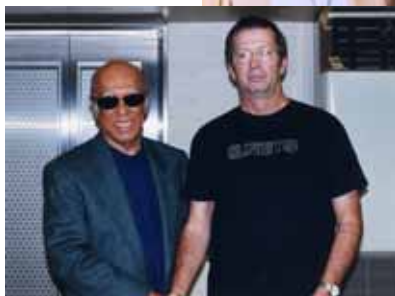
with Eric Clapton