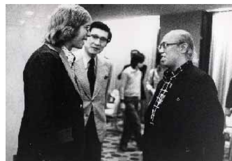
with John Denver