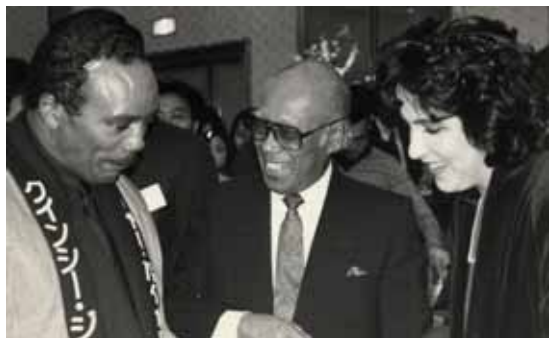
with Quincy Jones