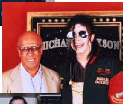
with Michael Jackson