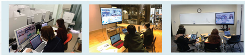
Zoom等を活用したチーム活動の様子