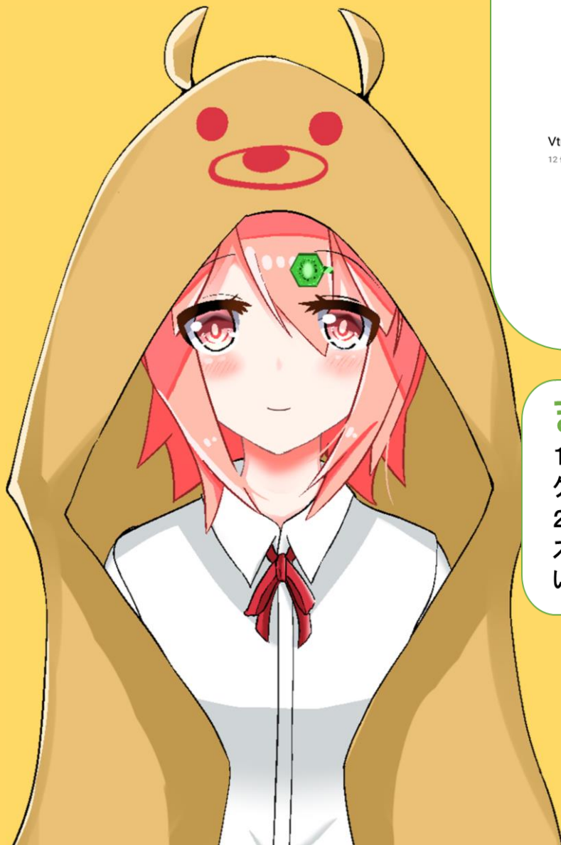
図2 バーチャルのっティ