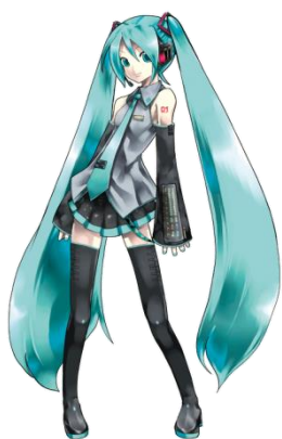
ボーカロイド（初音ミク）

近年小学生に人気のあるボーカロイド（初音ミク）を使い防災教室のPVを作成し、防災について興味を持てるようにする。そして防災について家族で話し合えるように仕向ける。