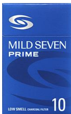
日本のパッケージ