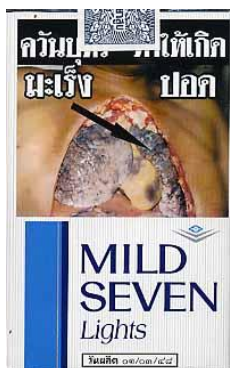
外国のパッケージ