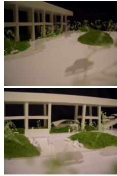
緑のコミュニティスペース