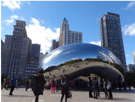
図2 ミレニアムパーク