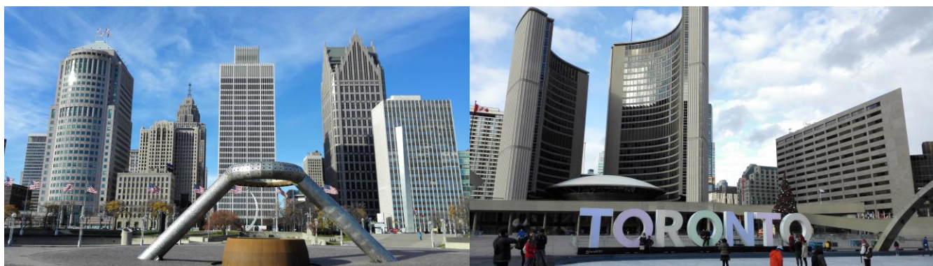
写真 1 デトロイトの様子

11 月下旬に Thanksgiving があり 1 週間ほどの休みがありました。私は、デトロイト、トロント、フィラデルフィアに旅行に行きました。写真 1 にデトロイト、写真 2 にトロント、写真 3 にフィラデルフィアの様子を示します。デトロイトではアメリカ人のバディの家に、フィラデルフィアでは中国人の友人の親戚の家に滞在しました。学生のアパートメントとは違ったアメリカの家庭の雰囲気を感じることができました。また、初めて陸路で国境を越える経験や、それぞれの街の異なる様子を知ることができてとても充実した休暇でした。